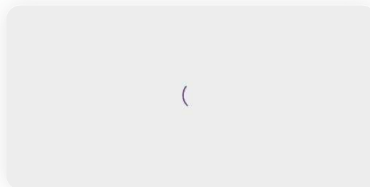
Presidente do Banco Central do Brasil, Roberto Campos Neto.

Para Campos Neto ainda há dúvidas se o aquecimento do mercado de trabalho e o aumento da atividade econômica podem ter reflexos na inflação. "Não necessariamente é o fato de ter uma surpresa um pouquinho para cima no crescimento vai afetar a nossa projeção de inflação. A gente precisa ver como é que isso vai ser transmitido para a parte de preços", disse.